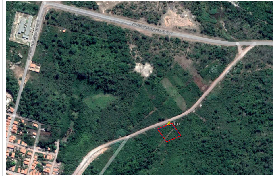
ÁREA DESTINADA A CONSTRUÇÃO DA ESCOLA