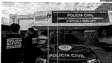
Investigação da tentativa de homicídio tem prosseguimento na SHPP

Os criminosos efetuaram vários tiros em direção a vítima, um deles